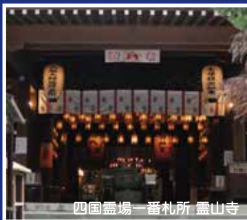
四国霊場一番札所 霊山寺